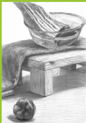
武蔵野美術大学視覚伝達デザイン学科