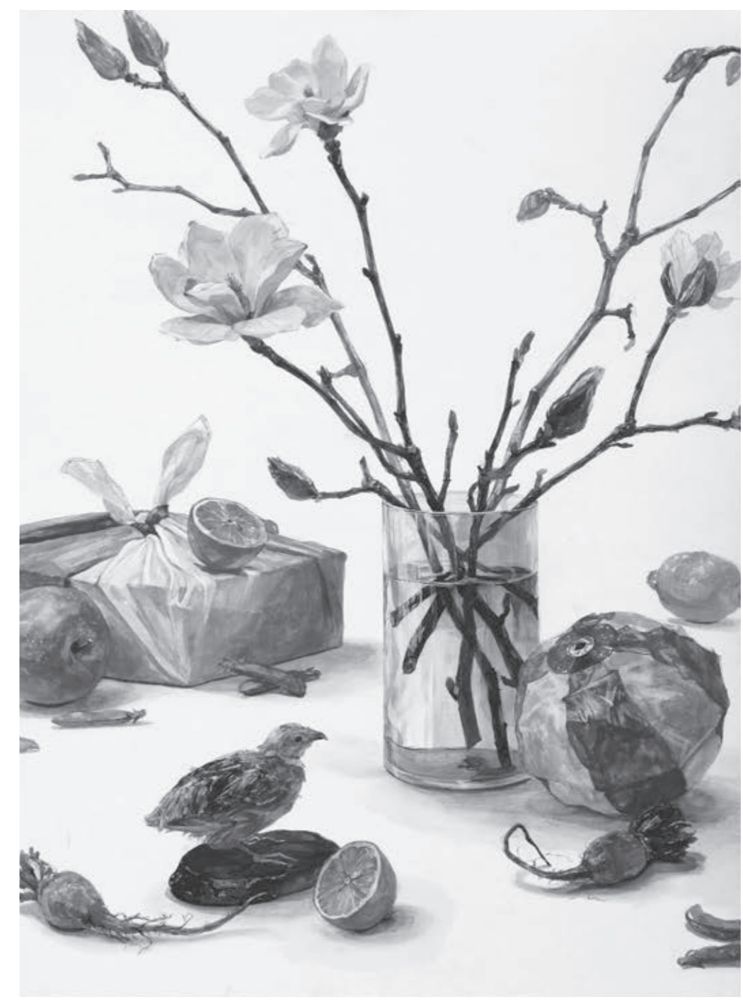
東京芸術大学日本画合格者作品